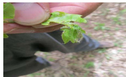
تغذیه لارو از برگ‌ها