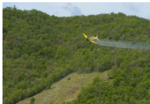
محلول پاشی هوایی