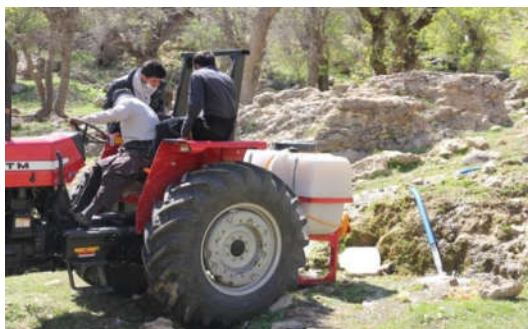
محلول پاشی حشره کش میکروبی